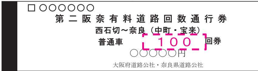
（図1）【回数通行券冊子の表紙】